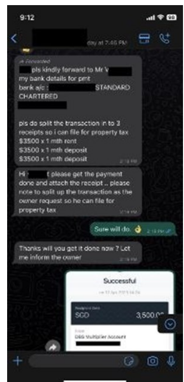
Conversation between the scammer and the victim

For more information on this scam, visit SPF | News (police.gov.sg)