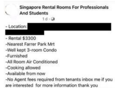
Tangkap layar Kiriman Sewaan di Facebook

Untuk maklumat lanjut mengenai penipuan ini, sila layari SPF | News (police.gov.sg)