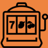
Lucky Draw Scam