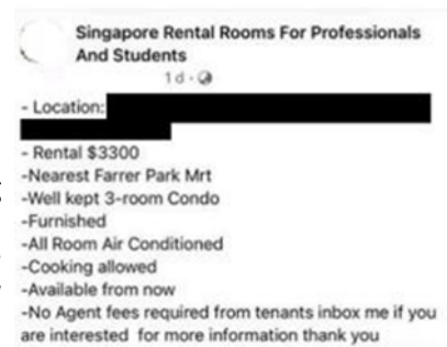
Fraudulent Rental Posting on Facebook

Visit www.go.gov.sg/spf-scamresources for a copy of SPF's Anti-Scam Resource Guide.