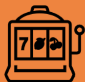
Penipuan Cabutan Burtuah