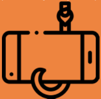
Penipuan Pancingan Data (Panggilan Menyamar Sebagai Agensi Pemerintah)