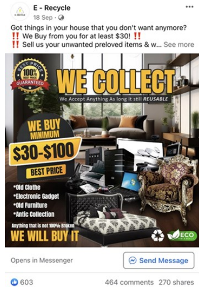
[Contoh sebuah iklan Facebook menipu]