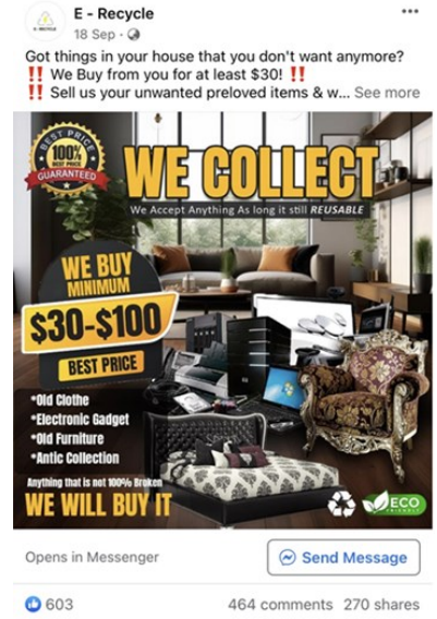
[மோசடி ஃபேஸ்புக் விளம்பரத்தின் உதாரணம்]

இந்த மோசடி குறித்த மேல் விவரங்களுக்கு, SPF | News (police.gov.sg) இணையத்தளத்தை நாடுங்கள்.